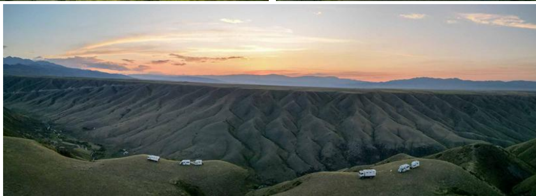
Gag de la fusion de photos pour faire un panoramique... le premier plan s'est dupliqué !