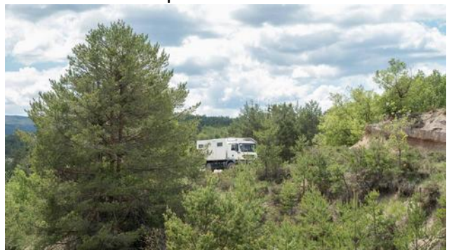
Khronos vu depuis le pont