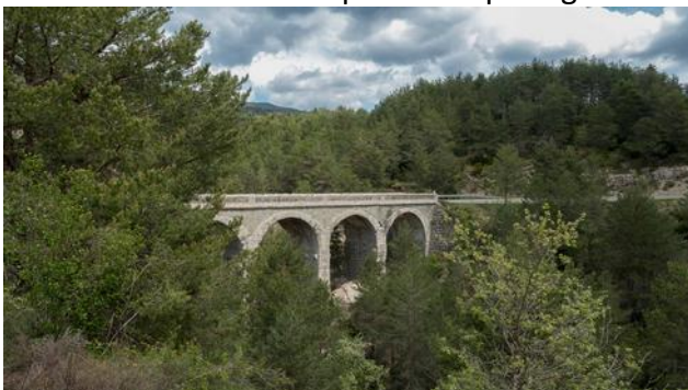
Le pont vu depuis Khronos

Nous faisons une pause à côté d'un joli pont sur la A-1604 qui passe par le col de Sarrablo. A voir les photos juste en dessous, l'endroit paraît être un bivouac sympa. Mais la photo suivante montre la réalité du lieu. On dirait un bivouac de Park4night : photo attirante et quand tu arrives tu te demandes comment on peut oser partager un lieu de bivouac aussi peu intéressant !!!